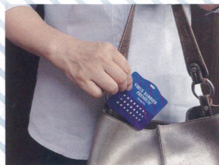
かばんに入れて持ち歩いたり