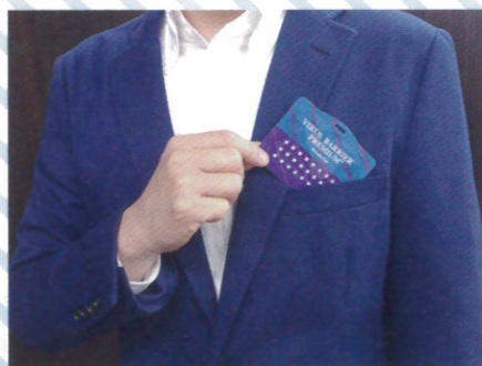
胸ポケットに入れて