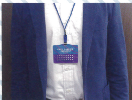
ストラップに吊り下げて

袋から取り出したらそのままお使いいただけます。 ストラップに取り付けて首から掛けたり、胸ポケットに入れたりと使い方は様々です。