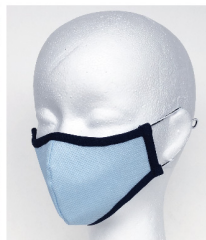
鼻からアゴまでしっかりフィット