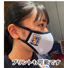
プリントも可能です