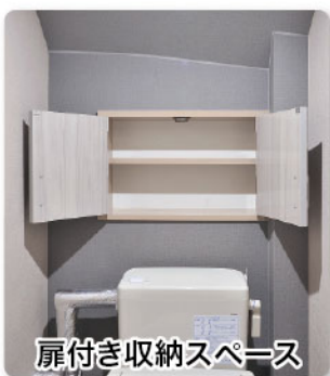
扉付き収納スペース