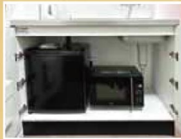
冷蔵庫・電子レンジ