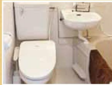
シャワートイレ・洗面所