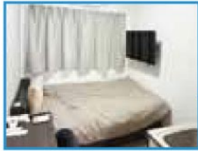
セミダブルベッド