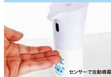
センサーで自動噴霧

外形寸法 W105×H205×D87mm 給水方法 タンク式 容量500ml 使用電池 単三アルカリ電池×4本 動作電圧 DC4V 重量 350g