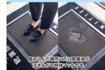
踏み込んだ場所だけに除菌液が 浮き上がる特殊マットです。

外形寸法 W900mm×H1100mm (除菌トレイ W490mm×H690mm)