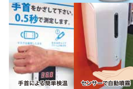
手首による簡単検温