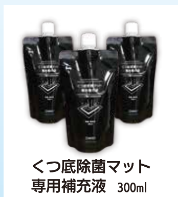
くつ底除菌マット 専用補充液 300ml