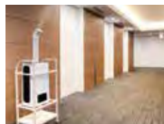
フロア噴霧イメージ ※専用カートもご購入いただけます。