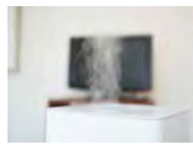
ミストが熱くならないので安心・安全