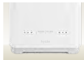
間欠運転機能でランニングコストを削減