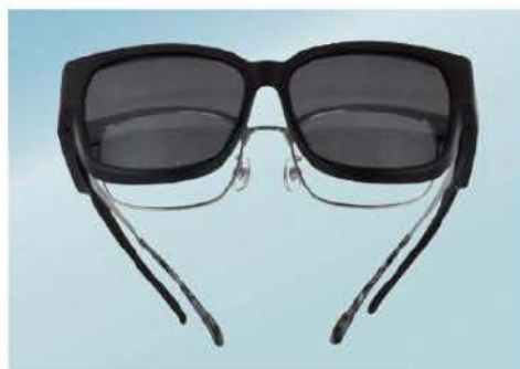
お持ちの眼鏡の上から装着