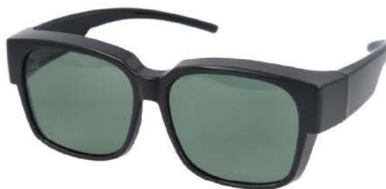
C シャイニーブラック/グリーン(偏光)