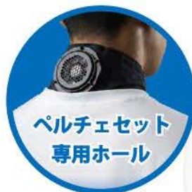
ペルチェセット 専用ホール

品番 PNC-01 サイズ フリーサイズ カラー ブルー・ブラック 素材 生地 綿35% ポリエステル65% 内容物 指定外繊維(ベルオアシス)30% アクリル30% その他繊維40%