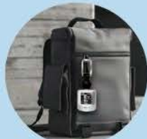
バッグに取り付け