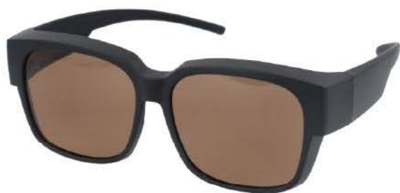
B マットブラック/ブラウン(偏光)