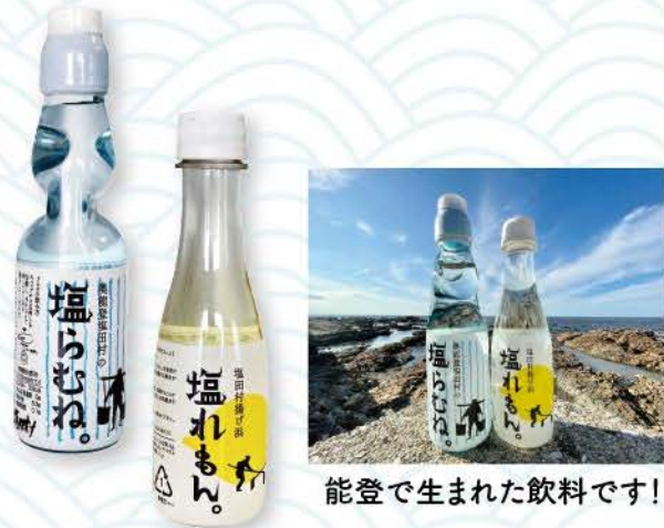
能登で生まれた飲料です！

奥能登揚げ浜 塩れもん。 (容量/250ml) 1箱50本入り 品番:EDM-03