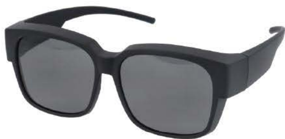
A マットブラック/スモーク(偏光)