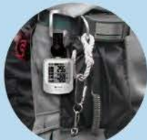
ベルトに取り付け